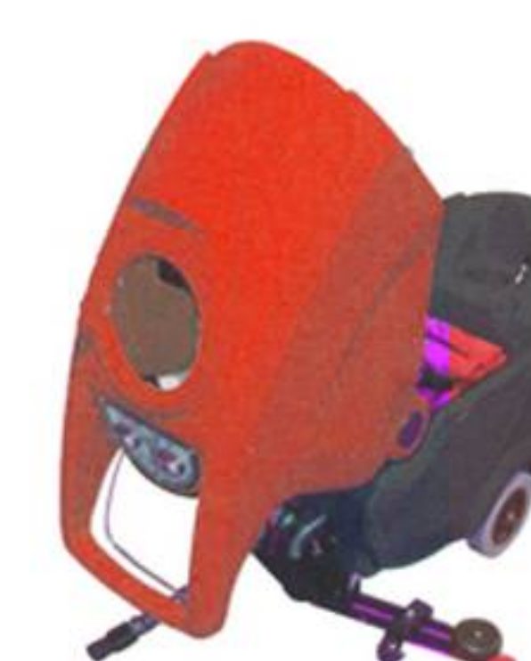
serbatoio di recupero removibile