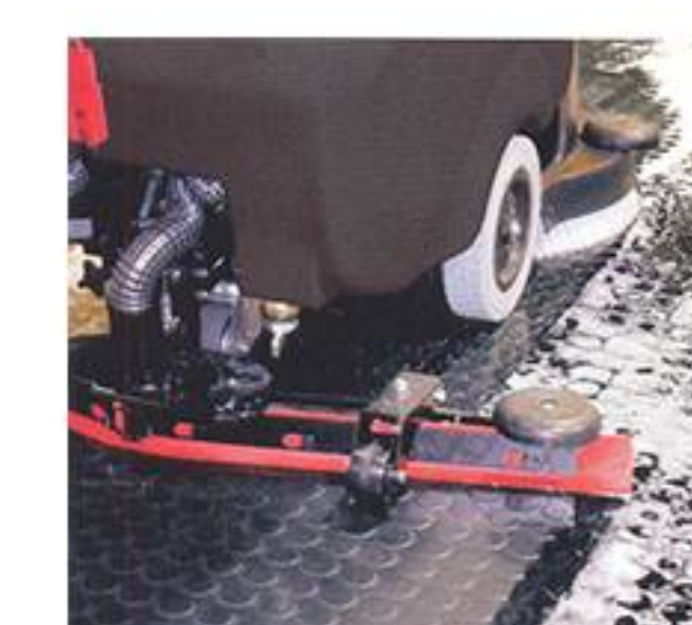
tergipavimento che assicura alte prestazioni e bassi costi